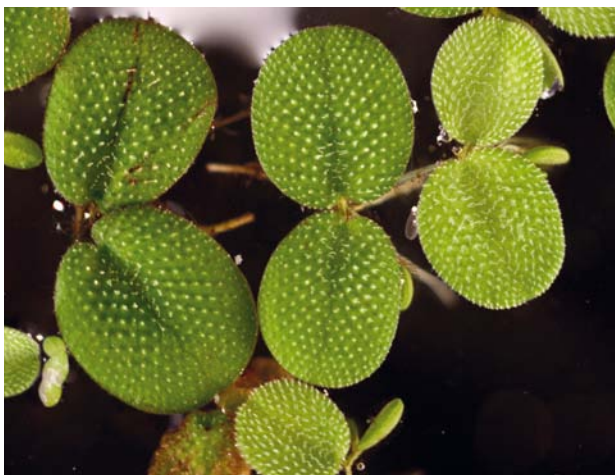
AFBEELDING. 2. | Bladparen van de recente vlotvaren Salvinia natans uit de Hortus Botanicus te Leiden. Lengte van een blaadje ongeveer 1 cm.

Al zo'n 200 jaar is in het gebied verzameld en er zijn talloze publicaties over verschenen. De mooiste vondsten zijn gedaan in de buurt van het nu verdwenen dorp Preschen, waar nog steeds worden waardevolle fossielen gevonden. Door het grote aantal soorten heeft men statistisch onderzoek kunnen doen naar de verschillende vegetatietypen, die in het landschap voorkwamen.