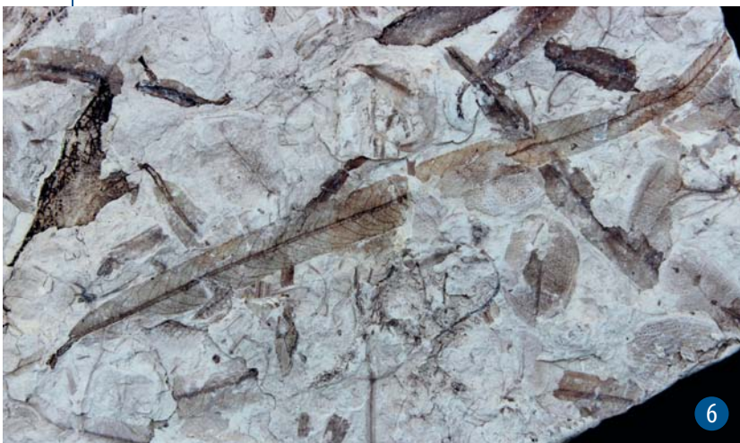
AFBEELDING. 4. | Vrouwelijke katjes van de wilg Salix haidingeri . Rechts met de macrosporangia nog aangehecht, links zijn ze afgefallen. Breedte linkerfoto 12 mm, breedte rechterfoto 2 cm. Foto's: Hans Steur.