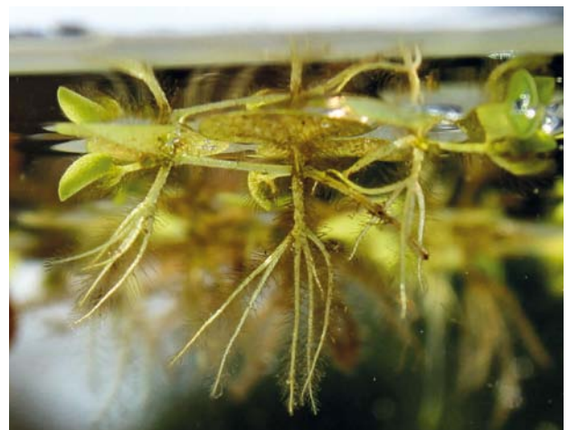
AFBEELDING. 3. | Het derde blaadje van Salvinia natans heeft de vorm van een worteltje gekregen.