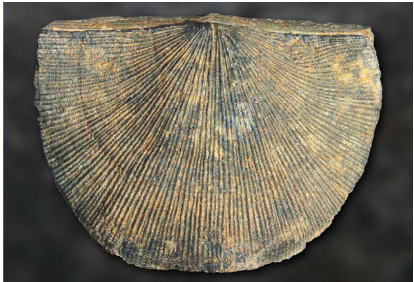
AFBEELDING 8. | De strophomenide Xyphostrophia umbraculum . M-Devoon, Givetien, Jebel Makrib, Marokko. Hoogte schelp: 49 mm. Collectie S.W.B.