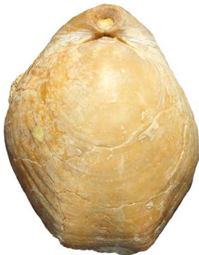
AFBEELDING 5. | De terebratulide Terebratula costae . Aanzicht van rugklep; aan de bovenzijde is de rand van de buikklep zichtbaar, met steelopening. Hoogte van de schelp 7,5 cm; Novoli, Lecce, Mioceen. Collectie S.W.B.

Brachiopoden behoren, net als de tweekleppigen, tot de dieren die minuscule voedseldeeltjes (zoals éencelligen en larven van ongewervelde dieren) uit het water opnemen. Daar is een waterstroom langs een vangmechanisme voor nodig. Baleinwalvissen, die ook een dergelijke voedingsstrategie gebruiken, bewegen door het water, nemen via het openen van de bek veel water op en persen dit door hun baleinen door het sluiten van de bek, waarbij het plankton achterblijft. Dit vergt veel energie. Tweekleppigen en brachiopoden laten het water een groot deel van het werk doen: zij zitten op één plaats, zetten de kleppen voor lange tijd open en maken gebruik van de beweging van het water en van een vangmechanisme met een door trilharen getransporteerde slijm laag. Brachiopoden beschikken over lofoforen als vangmechanisme. Elk dier heeft er één, met twee armen (vandaar de naam armpotigen, of Brachiopoda in het Latijn). Het water komt de schelp aan de zijkanten binnen en wordt geleid over de armen met uitsteeksels die met heel fijne trilharen zijn bezet en verlaat het dier via een uitstroomopening in het midden. Het gevangen voedsel wordt naar de mondopening geleid. Bij veel brachiopoden rollen de armen lusvormig of spiraalvormig op wanneer de dieren groter worden. Dat was ook het geval bij Costatrypa variabilis (Afb. 1).