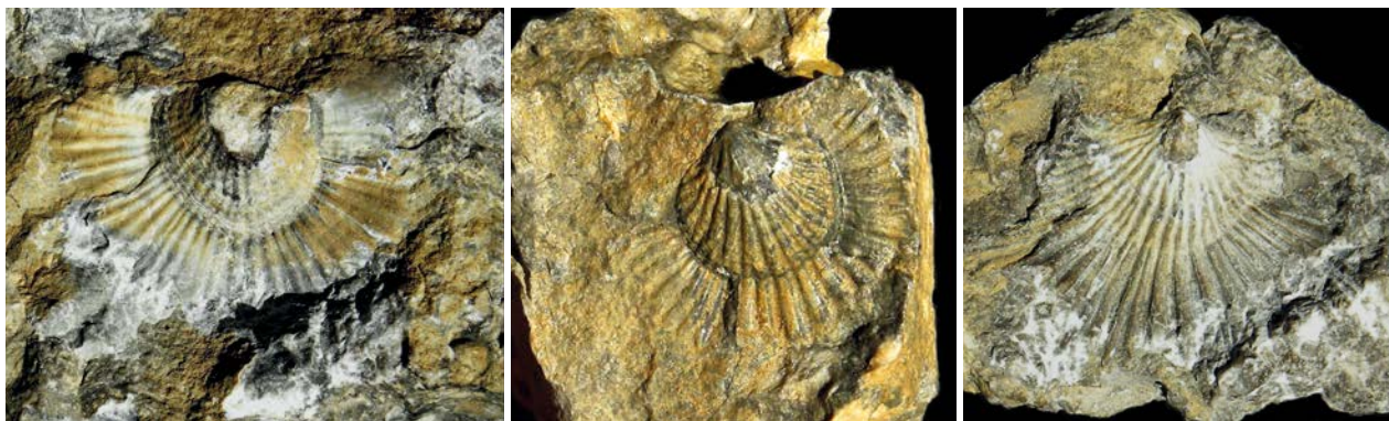
AFBEELDING 3. | Costatrypa variabilis , met kraag. Drie exemplaren uit de groeve La Cimetière te Boussu-en-Fagne. Hoogte met kraag 30-33 mm.

De brachiopoden worden traditioneel ingedeeld in twee hoofdgroepen: de Inarticulata en de Articulata (zie Milson en Rigby, 2009 voor recente alternatieve indelingen). De eerste groep, waarbij de kleppen met spiertjes bij elkaar worden gehouden, is de oudste en deze was in het Onder-Cambrium al vertegenwoordigd. De Articulata, met een complex getand scharnier, kennen we vanaf het Midden-Cambrium en deze overheersten de Inarticulata al snel daarna in soortenrijkdom en diversiteit. Voor een overzicht van de soortenrijkdom van de brachiopoden, zie Winkler Prins (1989, 1990, 1991).