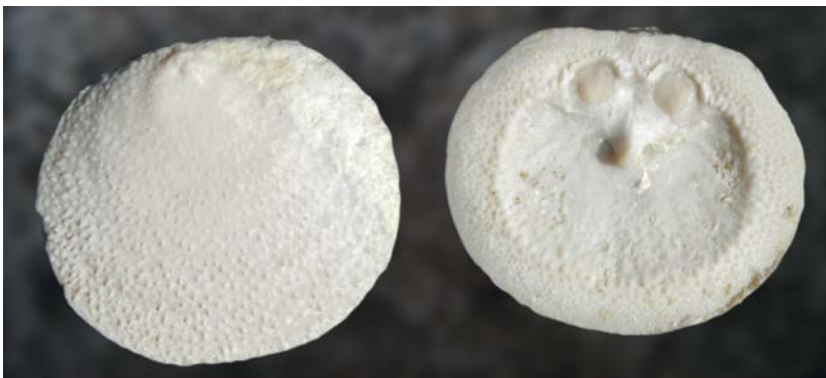
AFBEELDING 6. | Buitenzijde en binnenzijde van de rugklep van een craniïde. De groep dankt zijn naam (cranium = schedel) aan de spierafdrukken ("ogen") en het aanhechtpunt van de lofofoor ("neus") van de rugklep. Boven-Krijt, Denemarken. Hoogte kleppen: 13 mm. Collectie S.W.B.

Andere strophomeniden die in een modderige omgeving hebben geleefd, bezaten vrij grote en lichte kleppen, waarbij de buikklep licht convex en de rugklep licht concaaf was. Ze lagen waarschijnlijk met de bolle kant naar boven, wat de meeste stabiliteit gaf in stromend water (Afb. 4D, 8). Deze dieren konden kennelijk voorkomen dat ze in de modder wegzakten door hun grote oppervlak en bleven op hun plaats omdat ze door hun platheid weinig weerstand boden aan het water. Veel brachiopodenfamilies stierven uit aan het eind van het Devoon. Maar de strophomeniden, waaronder veel bewoners van zachte bodems, wisten zich heel goed te handhaven in het Carboon en Perm en behoorden zelfs tot de weinige overlevenden van het grote uitsterven aan het eind van het Perm, toen 90 procent van de brachiopodenfamilies verdween. Een belangrijke groep vormen de Productacea, waaronder de vrij be-