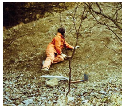
AFBEELDING 2. | De groeve La Cimetière bij Boussu en Fagne in 1990, toen er nog gezocht kon worden.