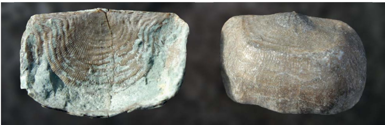
AFBEELDING 7. | Rugklep (l) en buikklep (r) van Leptaena depressa . Siluur, Muldeformatie, bij Djupvik, Gotland. Hoogte van de buikklep: 26 mm. Collecties H.S. en S.W.B.